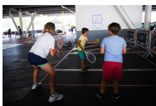
Mur avec cibles (ruban adhésif)