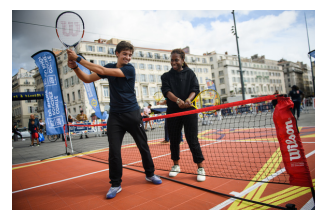
Filets amovibles (3 ou 6 mètres)