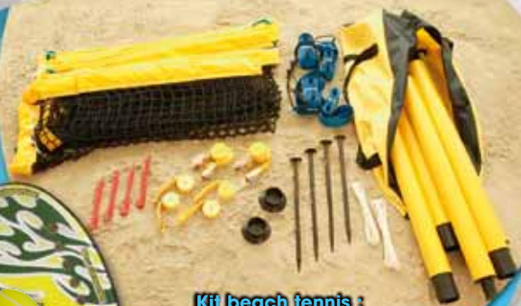
Kit beach tennis : poteaux de jeu, filet et lignes de délimitation.