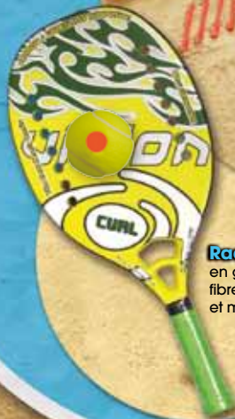
Raquette : en graphite, fibre de verre et mousse EVA.

Il est possible d'acheter le matériel nécessaire à la pratique du beach tennis auprès de la Centrale du club de la FFT, www.fft.fr , ainsi que chez certains distributeurs.